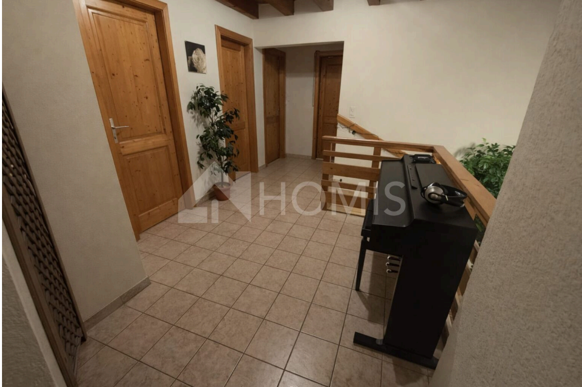
Hall à l'étage