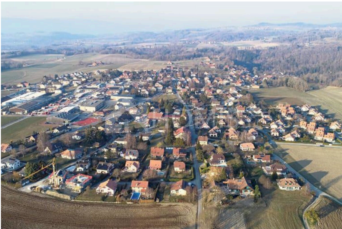
Vue aérienne de Bercher